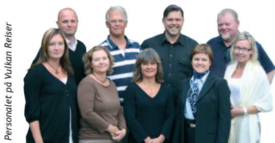
Personalet på Vulkan Reiser

www.vulkanreiser.no/gruppereiser_konferansereiser_tjenester/gruppereiser/