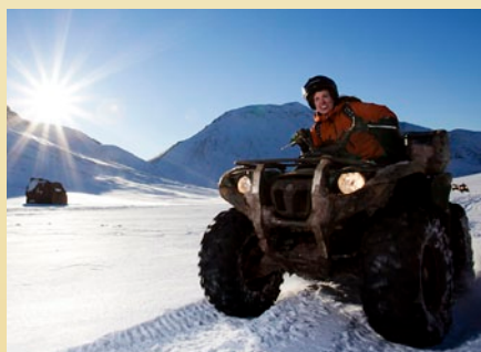
Eventyr i villmarken